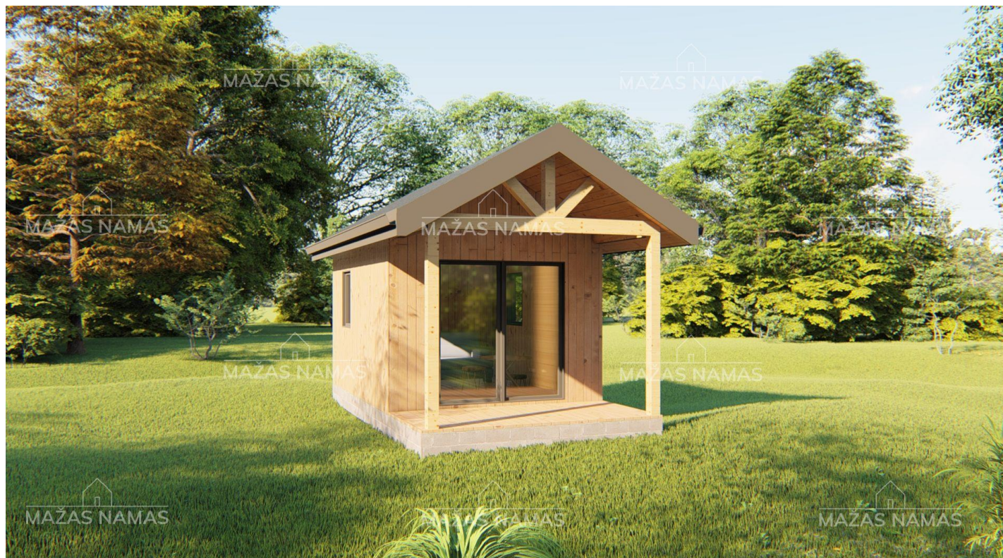
Karkasinis namelis ELAU 3 X 5.5