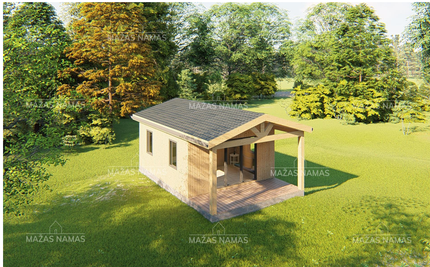
Karkasinis namelis ARCOLE 6x8m